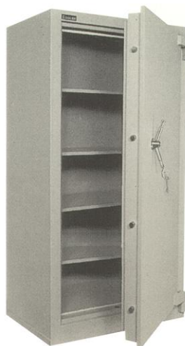
Ref. 303 Mod. D-1