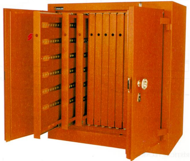
Ref.: 310 Mod. 2-P